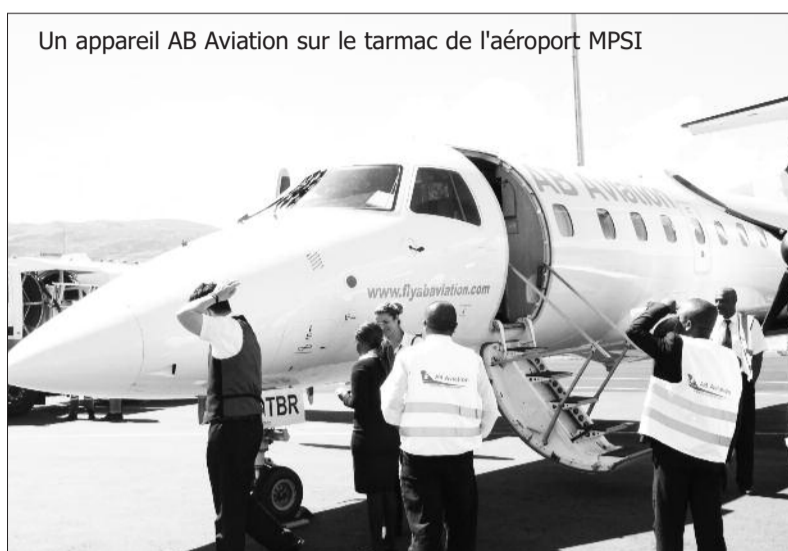
Un appareil AB Aviation sur le tarmac de l'aéroport MPSI