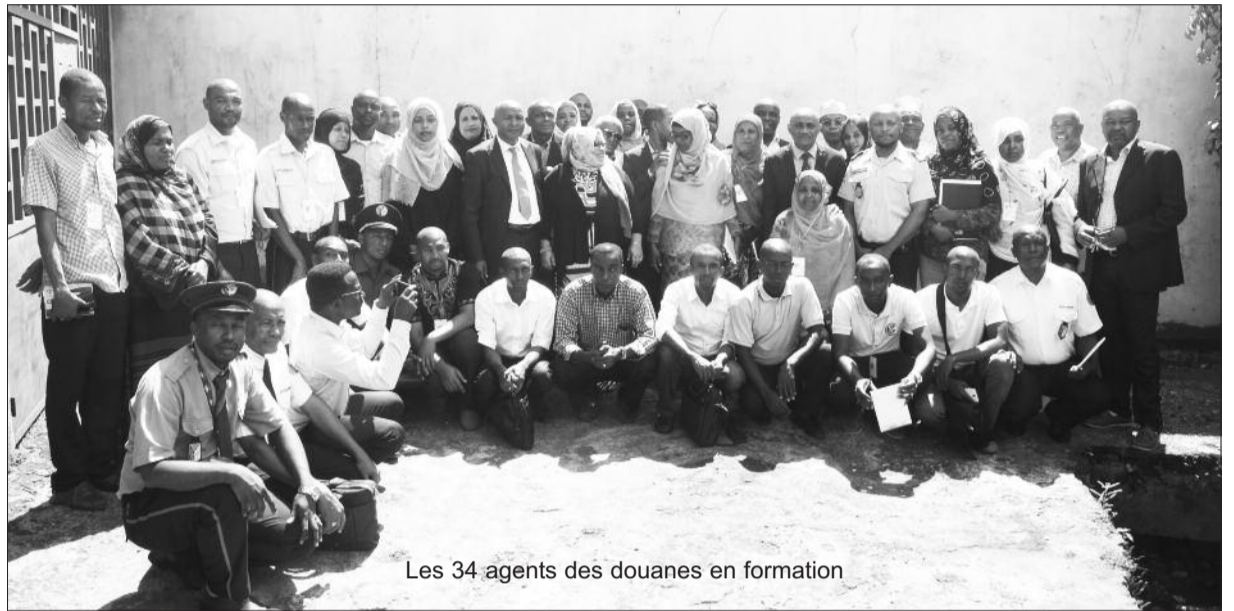
Les 34 agents des douanes en formation

Cette formation de base est d'une durée de trois mois et a comme objectif d'accroître le niveau des compétences et les capacités opérationnelles de tous les agents des douanes. « Je suis conscient que l'on ne peut pas exiger la performance sans favoriser la compétence. C'est pourquoi j'ai tout fait pour que ces séries de formations voient le jour », poursuit-il. Sur 34 agents, deux groupes de 17 agents seront constitués pour rendre la formation pertinente.