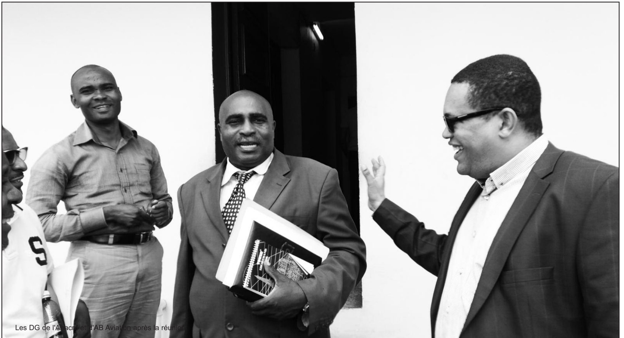
Les DG de l'ANAC et d'AB Aviation après la réunion

Après sept mois et douze jours d'inactivité, la compagnie aérienne AB Aviation vient d'obtenir de l'aviation civile les autorisations lui permettant de reprendre ses activités. Le premier vol domestique est prévu pour ce samedi.